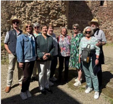
Die Gruppe Mosaik bei der Stadtführung „Jüdisches Leben in Speyer“ am 25. April 2026