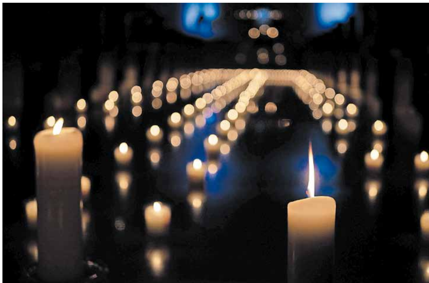
Das Licht spielt als Symbol in den christlichen Kirchen eine ganz besondere Rolle. Viele Kirchengemeinden bringen dies in besondere Form zum Ausdruck, etwa durch Musik und Texte rund um die ökumenische Bewegung von Taizé.

„Bin ich der Hüter meines Bruders?“ (Gen 4,9) – Menschenrechte heute