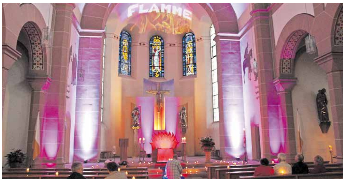
Die Kirchengemeinde St. Martin in Bexbach lädt ein, Gottes Schöpfung mit allen Sinnen zu erfahren.

Gottes Schöpfung mit allen Sinnen erfahren!