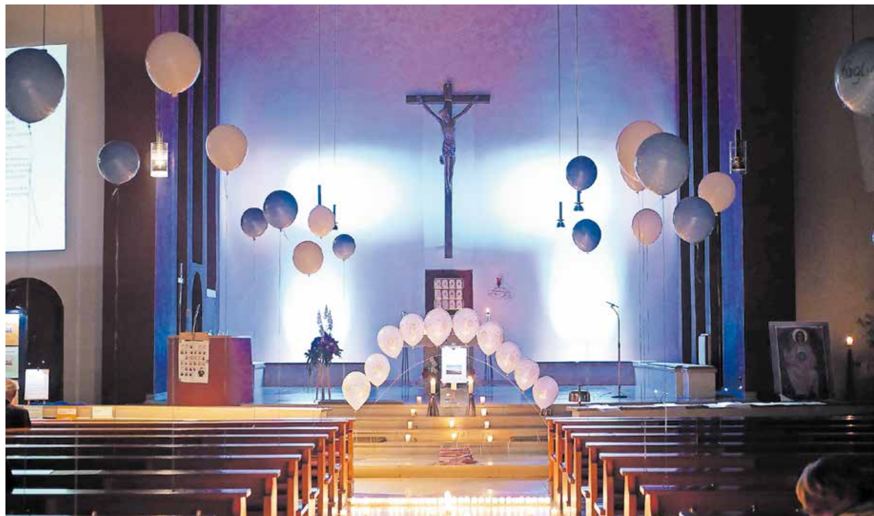
Das Licht erhellt die Nacht. Licht ist in vielen Kulturen ein uraltes Symbol für das erwachende Leben.