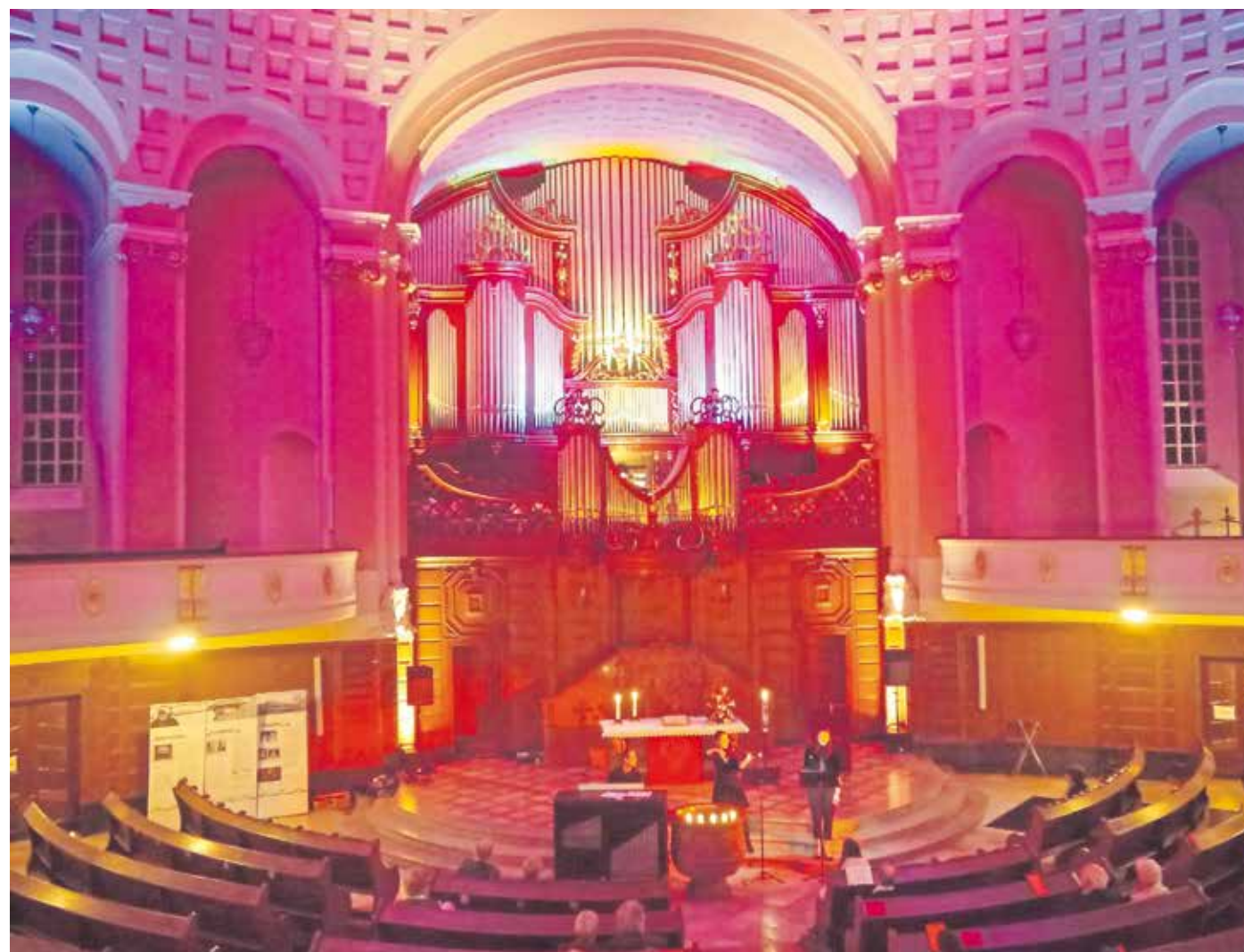
Die Farben des Lichts erzeugen eine ganz besondere Stimmung wie hier in der Völklinger Versöhnungskirche.

19.45 Uhr: Orgelmusik zur Begrüßung und Einstimmung 20 Uhr: Einführung in das Kirchenbauwerk von Baumeister Gottfried Böhm 20.15 Uhr: Sakrale Kunst in der Kirche von Ernst Alt 20.45 Uhr: Musikalischer Abend mit dem Gospelchor „GosPeople“ 22 Uhr: Begegnung am Pfingstfeuer mit kleinem Imbiss und Gesprächen. Anschließend Abschluss und Segen