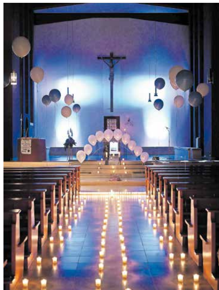
Im Geist der Ökumene wird die Nacht der Kirchen am Pfingstsonntag gefeiert.