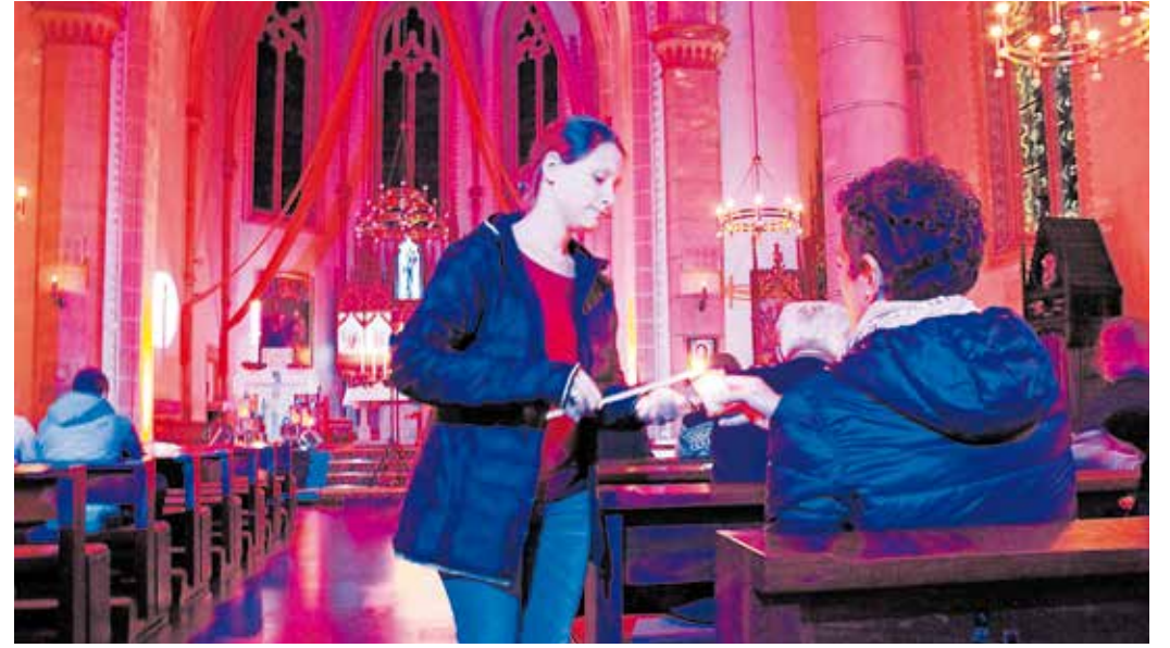
Die Kirchengemeinde Marpingen beteiligt sich auch in diesem Jahr wieder an der Nacht der Kirchen.

20 Uhr: Eröffnung – Konzert des Jugendchors der Pfarreien