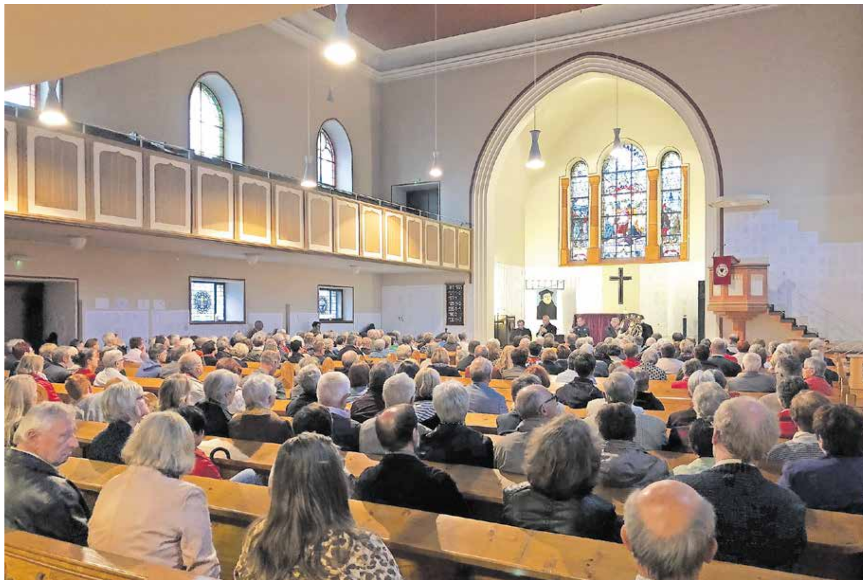
Kirchen werden zu Kinosälen, Konzerthallen, Meditationsräumen oder Kleinkunsthöfen, wie hier in St. Ingbert.

Mehr als 50 Kirchen im Saarland laden zur Begegnung ein. Programm: www.nacht-der-kirchen-saar.de