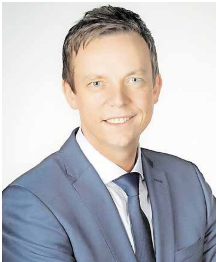
Der Ministerpräsident des Saarlandes, Tobias Hans, hat auch in diesem Jahr die Schirmherrschaft übernommen.