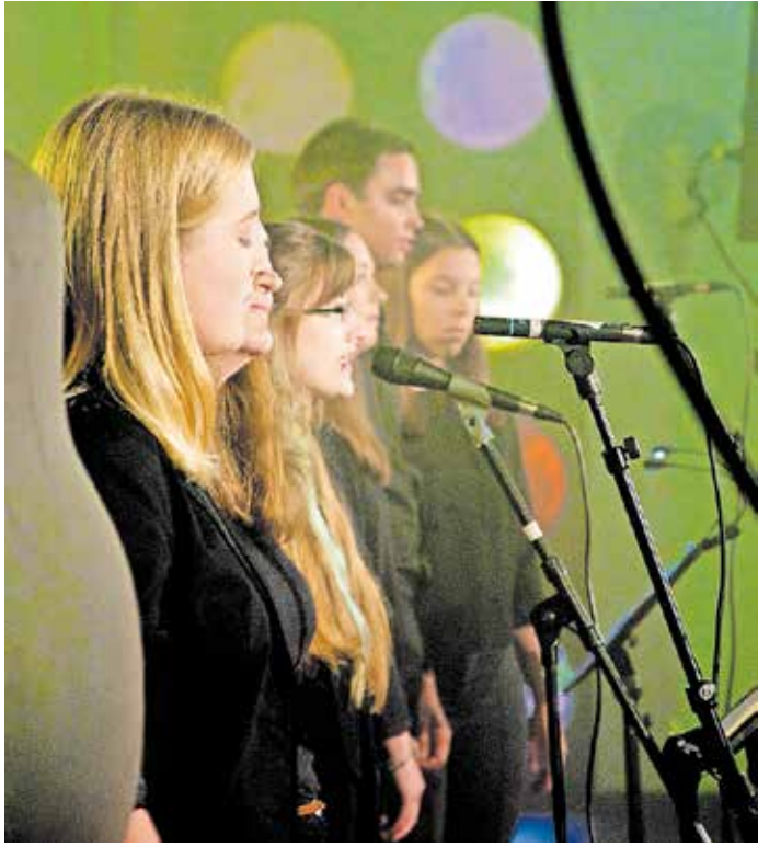
Die „Holytones“ aus St. Wendel-Winterbach gestalten die Eröffnung musikalisch.

Mehr als 50 Kirchen im Saarland laden zur Begegnung ein. Programm: www.nacht-der-kirchen-saar.de