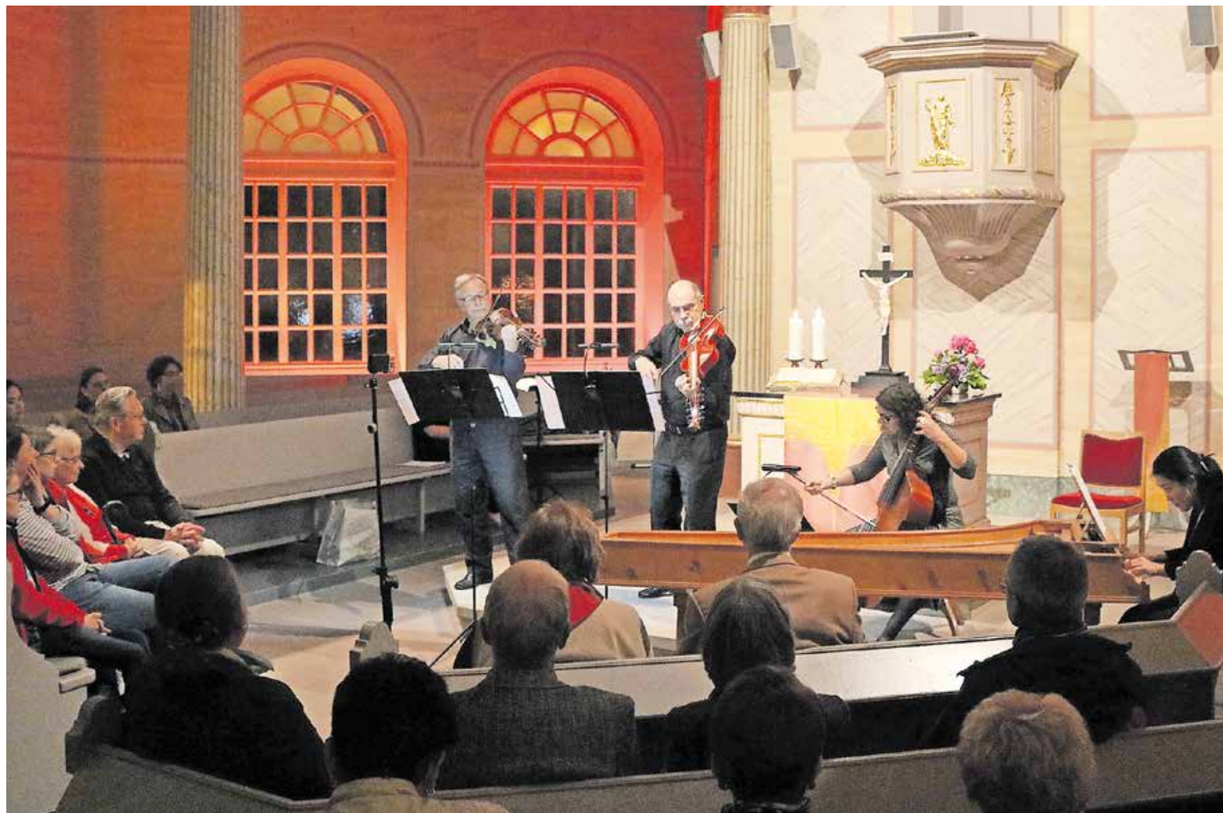
Die Schinkelkirche in Bischmisheim, ein architektonisches Juwel, verwandelt sich zur Nacht der Kirchen in eine „Musik-Kirche“ mit ganz unterschiedlichen Angeboten.

Mehr als 50 Kirchen im Saarland laden zur Begegnung ein. Programm: www.nacht-der-kirchen-saar.de